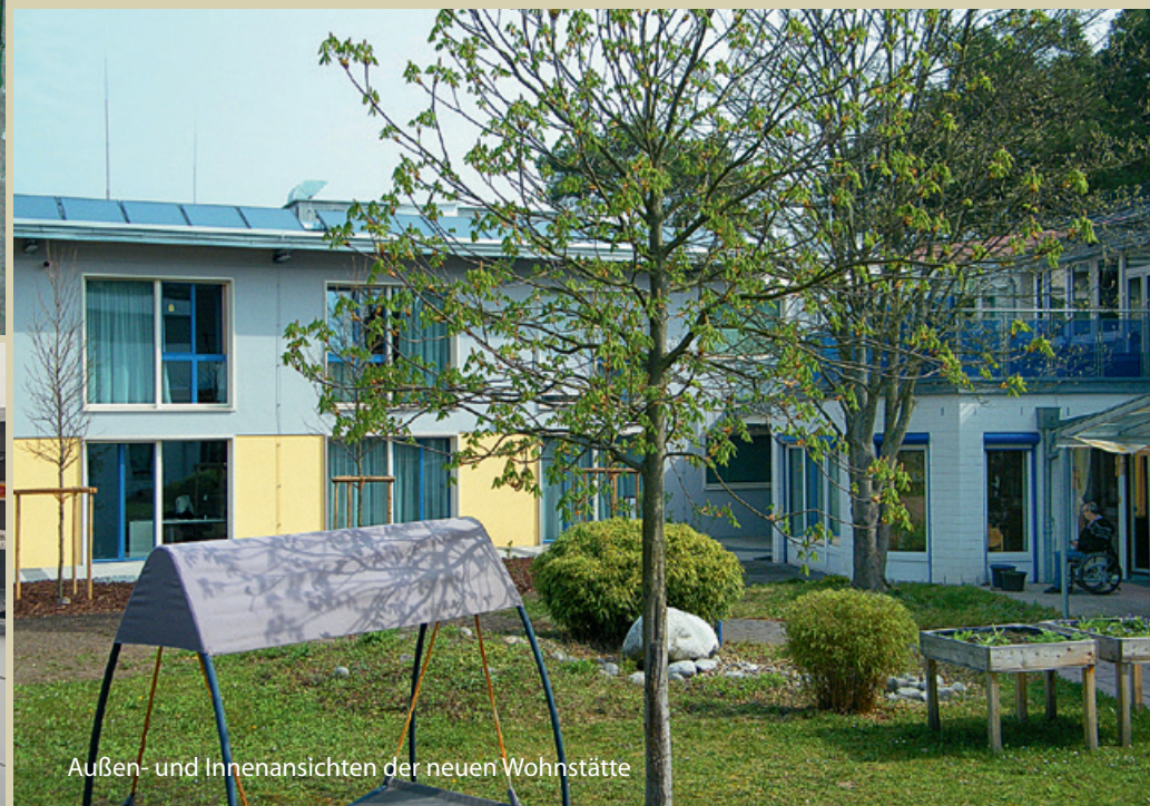
Außen- und Innenansichten der neuen Wohnstätte